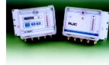
Новые модели встроенных контроллеров IPC и IPC (DP)

Контроллер для работы во вредных условиях с пневматическим управлением