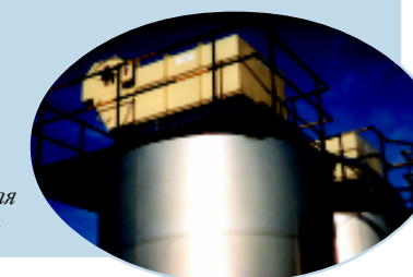
Применение для угольной пыли