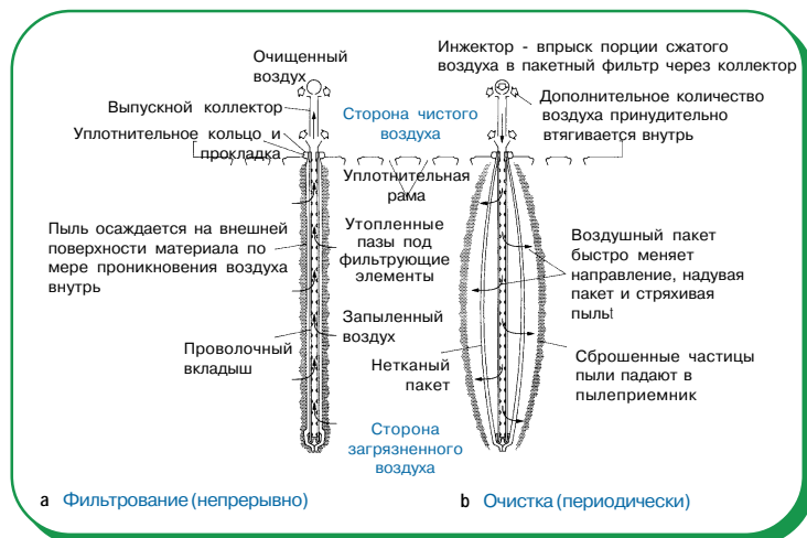
Вид уплотнительной рамы и двух фильтрующих элементов в разрезе, где показан принцип работы.

Для непрерывной работы пакетные фильтры регулярно очищаются автоматической продувкой сжатым воздухом. Кратковременный впрыск воздуха внутрь пакетного фильтра временно изменяет направление воздушного потока, надувая пакет и стряхивая с него осажденную пыль. Благодаря механическому воздействию при сокращении пакета эта пыль затем удаляется. Сброшенные частицы падают в пылеприемник для окончательной утилизации или возвращения в процесс.