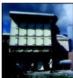
Приложение для литья латунных изделий.