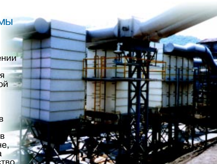
Процесс агломерации свинца.

При централизованном размещении данные фильтры позволяют проводить пылеочистку сразу для нескольких приложений с высокой пылевой нагрузкой. Модульная конструкция обеспечивает почти неограниченный выбор конфигураций гребенок и ярусов для любого фильтрующего материала. Поскольку для блоков требуется малая площадь в плане, установка может быть подобрана точно под имеющееся пространство.