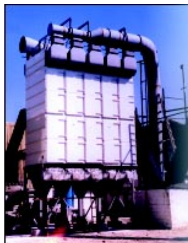
Применение фильтров на печи для выплавки свинца.

Корпусные блоки Даламатик с маркировкой DLMC представляют собой самое распространенное оборудование пылеочистки из выпускаемых компанией ДСЕ. Они предназначены для работы в самых тяжелых условиях. Их модульная конструкция обеспечивает самую разнообразную конфигурацию для каждого значения площади фильтрующего материала. Серия состоит из 45 типоразмеров от 45 до 1200 м 2 площади фильтрующего материала.