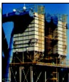
Крупное приложение для перерабатывающей промышленности.