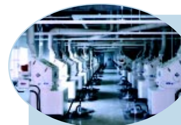
Фильтр на ленточном транспортере.