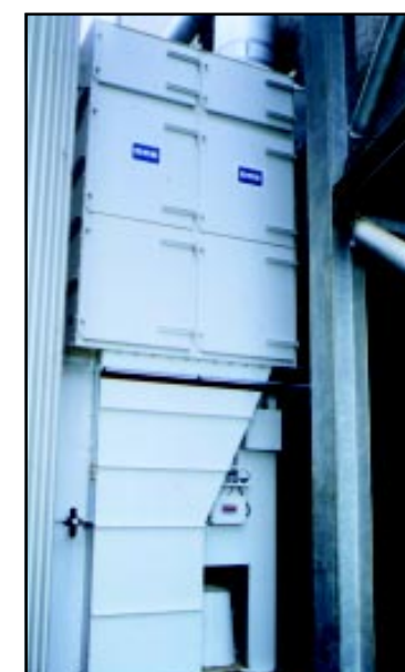
Приложение для шлифовки ячменя.

Каждый пакетный фильтр представляет собой мешок из нетканого материала, для которого используется только тщательно проверенный и изготовленный с минимальными отклонениями материал. Фильтр монтируется на специальную проволочную раму, чтобы обеспечить оптимальный воздушный поток и надежную очистку материала.